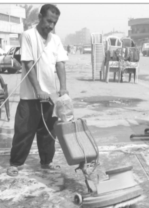
استعدادات شتائية؛ عامل ينظف سجاداً في اطار استعدادات البعثيين لاستقبال فصل الشتاء (الزمان).

بغداد- محمد صلاح بعقوبة- سجاد الخروصي كربلاء- علي الجنابي اعتقلت قوات الامن امس 67 شخصاً في اطار عملية الرعد الجارية في العراق. وقال مصدر مسؤول في وزارة الداخلية ل(الزمان) امس ان (حملات دهم مشتركة نفذتها قوات من الجيش والشرطة طالت مناطق الاضطية والبياع وسلمان باك في بغداد والديسبات في العمارة والحدياب في الموصل والمسيب وحديثة وكركوك والبصرة صباح امس اسفرت عن اعتقال 67 شخصاً).